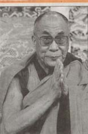
■ Dalai Lama